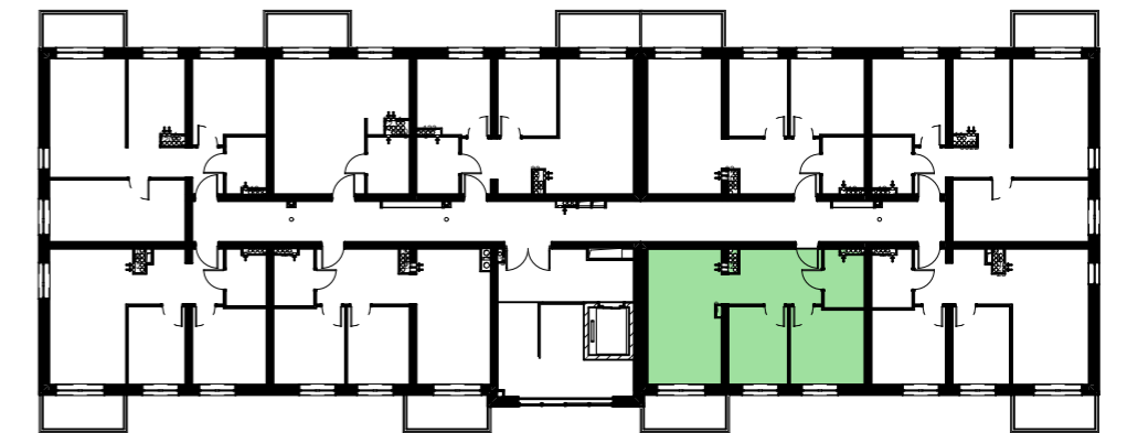
POZIOM+3-SCHEMAT LOKALIZACJI LOKALU