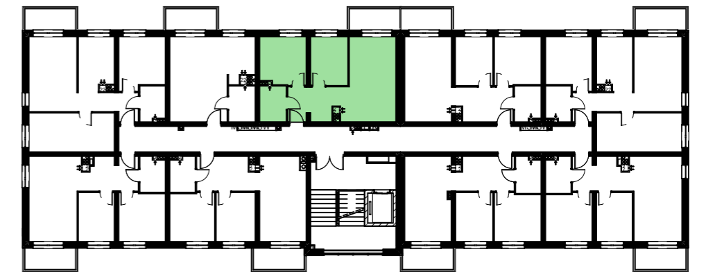
POZIOM+2-SCHEMAT LOKALIZACJI LOKALU